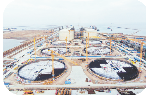
中海油LNG接收站项目