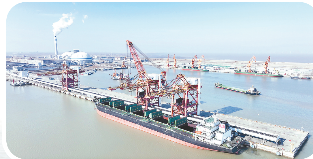
黄海新区滨海港码头

今年,黄海新区将积极推进滨海片区的中海油LNG扩建、国信2×100万千瓦清洁煤电、上海电气风电装备制造、凯金锂电池负极材料、天能锂电池综合利用、蓝素生物降解材料等9个重点项目全面开工;加快建设响水片区的德龙不锈钢拉丝、德龙不锈钢高线、天坦工业铝材、明阳智能装备等15个重点项目。