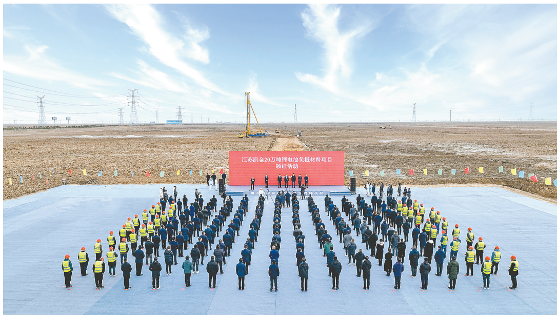
全市重大项目开工活动滨海分会场

项目是稳定增长的压舱石,也是高质量发展的动力源。招引更多优质重大项目、做好相关配套设施建设,提供积极主动的服务,是黄海新区实现“一年大提升、三年大变样、五年大跨越”的关键,更是其勇当沿海地区高质量发展排头兵的生动体现。今年,黄海新区建设的这批重点项目有哪些亮点?下面,让记者带大家先睹为快。