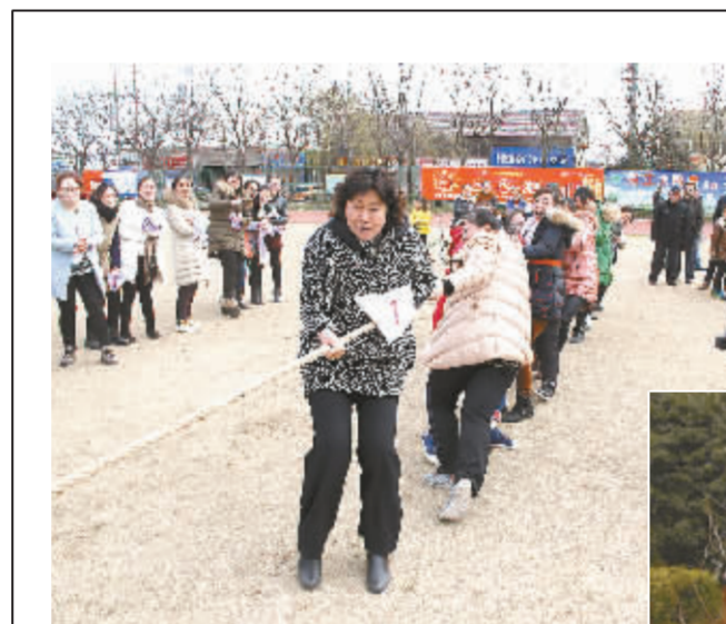
3月5日下午,射阳县中医院178位女职工会聚在院内杏林花园两侧,开展拔河、自行车慢骑、跳绳等项目比赛活动,庆祝“三八”妇女节。图为活动现场。

与此同时,扎实推进公共卫生服务均等化。全面提升11大类43项基本公共卫生服务,确保疾病控制、卫生监督、妇幼保健、精神病防治等卫生工作指标控制在省市先进行列。突出抓好重大公共卫生服务,不折不扣、保质保量完成项目任务。强化食品、饮用水卫生安全监管,确保不发生重大公共卫生事件。全力创建省卫生应急示范区,强化卫生应急管理,确保不发生群体性、影响大的公共卫生事件;切实提高医疗质量和服务能力。加大重点学科、专科建设力度,力争再创建1-2个省重点专科。加强与北京、上海等大医院横向协作,建立协作中心10个以上。加大镇卫生院特色专科建设力度,每个卫生院建成1-2个特色专科,全区特色专科达30个以上。突出镇、村医疗卫生机构适宜人才引进和培养,实施本、专科生按需招录。逐步实施卫生院领办村卫生室,村卫生室人员逐步由卫生院下派,纳入卫生院人员岗位管理;大力加强卫生行风建设。巩固党的群众路线教育实践活动成果,持之以恒纠正“四风”问题。严格执行党风廉政建设责任制,进一步落实党风廉政建设“两个责任”。深入开展行风专项治理工作,严肃整治“红包”、回扣、大处方、滥检查和乱收费行为,深化第三方评价结果的应用,提升群众对卫生工作的满意度。