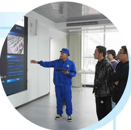
↑ 11月4日,工作人员在为游客介绍农业园的智慧控制中心。