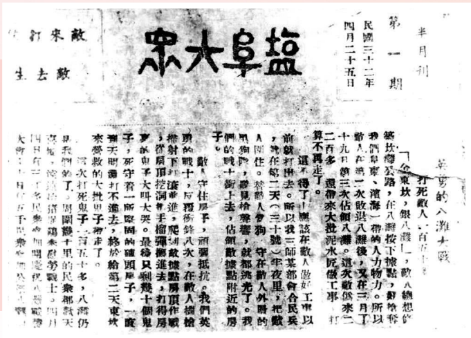
《盐阜大众》报关于八滩战斗的报道

1943年的春天,盐阜大地刚散去冬日的寒意,却被侵华日军的铁蹄搅得不得安宁。八滩位于东坎东北方向30公里,是内地通向黄海的咽喉之地、海盐和粮食的重要集散地,更重要的是,这里藏着新四军的兵工厂、被服厂和后方医院,是华中抗日战场的“大后方”,是战士们和老百姓心里的“定心丸”。可这份安宁,被日军的“扫荡”打破了。