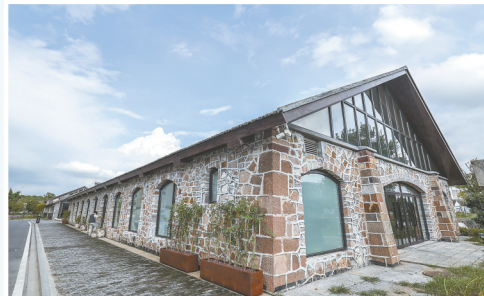
↑9月19日在沈荡镇拍摄的谷仓文化产业园咖啡馆。