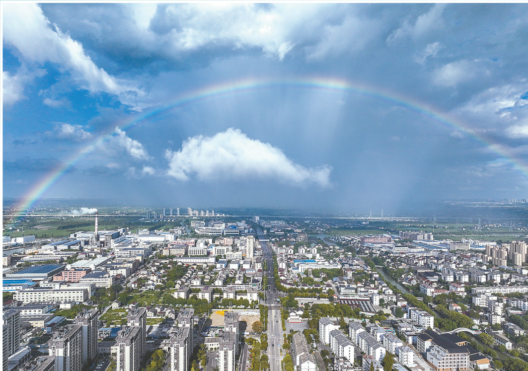
↑9月19日在沈荡镇拍摄的雨后彩虹(无人机照片)。