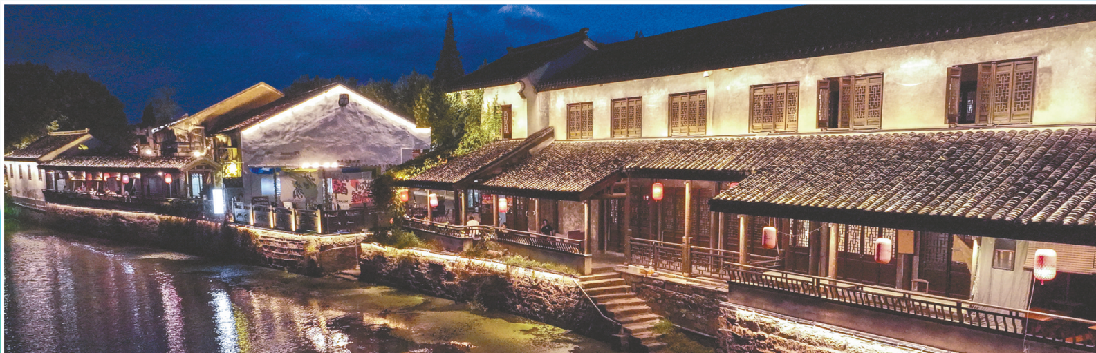
↑9月19日拍摄的夜色中的沈荡镇老街(无人机照片)。