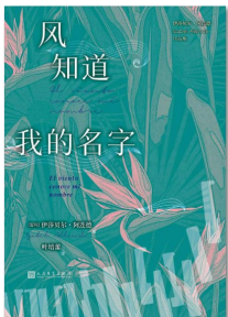
版本:人民文学出版社 作者:伊沙贝尔·阿连德 《风知道我的名字》