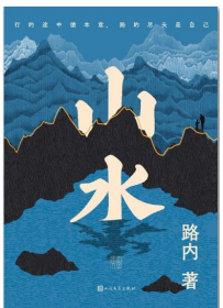
版本:人民文学出版社 作者:路内 《山水》