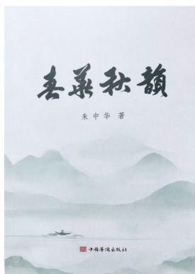
版本:中国华侨出版社 作者:朱中华 《春华秋实》

从散文文本叙事的角度来看,《母亲的情怀》以细腻的笔触勾勒出作者母亲的人生轨迹,着重描绘了母亲拖着病体,却依旧无怨无悔地操持家务、辛勤劳作的场景;《父亲的眼光》则聚焦作者高考落榜这一关键事件,叙述父亲毅然卖掉一头猪,支持作者报考函授大专学习的感人举动;《怀念岳父母》通过多维度叙事,一方面展现岳父长年在外从事地质物探工作的危险与艰苦,另一方面刻画岳母独自撑起家庭的勤劳与善良;《吾心飞扬赞吾妻》则生动描绘了妻子在作者参加公务员考试时,于考场门外守候一天的焦急与细心。这些作品所塑造的人物形象、所叙述的事件情节,皆源自真实的亲情体验,毫无虚构与夸张。正是这