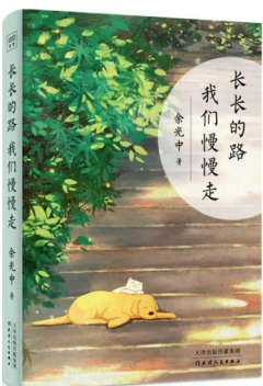
版本:天津人民出版社 作者:余光中 《长长的路,我们慢慢走》

人生这趟旅途,“去向远方”是每个人生命中最浪漫的冲动,也是每个人对抗孤独与现实的力量之源。除了写作,旅行是余光中的另一爱好。他认为“旅行不但是空间之变,也是时间之变。我们旅行的时候,常常会忘记今天是星期几,而遗忘时间也就是忘忧。”无论是踏上故土泉州的千年石梁洛阳桥,还是徜徉在开普敦的满城山色间,他不急于打卡式地记录地标,而是让脚步与心灵同步,在驻足凝视中,独自品味那绵长而精妙的人生哲理。“独游比较有益,因为较多思索”,而群游则容易使人“泯然众人”。重要的从不是抵达何处,而是沿途是否真的看