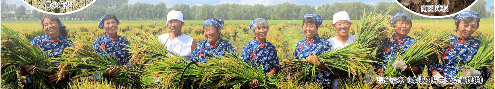
东台稻米

当琼港老渔民捧着文蛤笑言“养老有了依靠”，当返乡青年在辣根田头直播带货，当恒北梨农、东台瓜农、响水菜农等因手中的“金招牌”收获丰厚回报，这些浸润着汗水与智慧的“地理标志”，生动诠释了“土特产”如何蝶变为“世界货”，如何成为撬动一方百姓共同富裕的支点。其实，地理标志认证的不仅是产品，更是这片土地的未来。