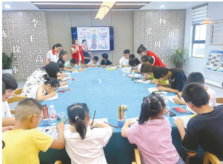
志愿者指导孩子用学到的安全知识作画

活动中,孩子们被精彩的讲解吸引,专注地听着每个细节。PPT里的真实案例配上志愿者生动的讲解,让防溺水“六不准”、交通安全规则这些生硬的条文,变成孩子们能听懂的“安全密码”。“谁知道过马路时要注意什么?”互动问答环节刚开启,一名小女孩就举手抢答:“要走斑马线,还要左右看!”她的回答引来一阵掌声。志愿者抛出问题,孩子们抢答,安全知识在欢声笑语中深植心间。安全教育绘画环节,孩子们在志愿者的指导下,拿起画笔将学到的安全知识融入画作中,一幅幅充满童趣的画作成为孩子们理解和践行安全知识的生动载体,进一步加深了他们对暑期安