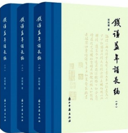
《钱谦益年谱长编》 作者：郑朝晖 版本：浙江古籍出版社