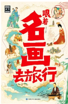
《跟着名画去旅行》 作者：穆然 版本：甘肃少年儿童出版社

南宋李煜登基后，将都城迁回金陵。当时的宫廷画家顾闳中被李煜派到韩熙载的家里，展开了一场“偷拍”行动。让人们没有想到的是，这幅“韩府情报图”却成了千古名作，即《韩熙载夜宴图》。它是一幅连环画，以故事发展的顺序，使用屏风分隔，呈现出听乐、观舞、暂歇、清吹、散宴五个场景，汇编成耐人寻味的故事——在一片歌