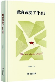
《教育改变了什么》 作者：刘少雪 版本：商务印书馆