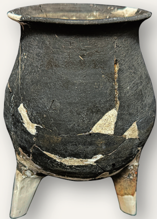
龙墩头遗址出土新石器时代晚期陶鼎