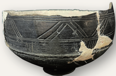
龙墩头遗址出土新石器时代晚期陶罐