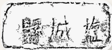
双元村遗址考古出土明城墙砖的拓印

记者获悉,盐城地处江淮东部平原,淮河、黄河、长江、大运河、海洋五大文化体系在此交融发展,催生出内涵丰厚、文脉悠长的独特历史文化,要想探明其渊源,传承其内涵,离不开考古学的学术支撑。回顾过往,盐城市文物保护和考古研究所联合江苏省文物考古研究院、南京大学、淮安市文物保护和考古研究所等学术单位在四普工作、文物保护、考古前置、科研合作等方面取得了显著成效。仅在2024年,即完成考古调查勘探委托51项,主持参与考古发掘19项,出土文物2000余件(套)。其中沙井头遗址入选国家文物局“考古中国”重大项目,6项社科课题获国家、省市级立项,2篇核心期刊论文系统阐述“江淮东部盐业考古理论与方法”,《寻味盐城——串场河沿线古代盐文化遗迹概览》等专著结集出版。这些成果不仅丰富了盐城地区的历史文化,也为研究盐城历史变迁、文化交流和社会生活提供了宝贵资料。