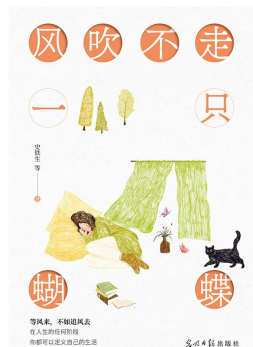
版本：光明日报出版社 作者：史铁生等 《风吹不走一只蝴蝶》

史铁生的文字风格，历来是直击心灵。在书中，他的文章同样充满了对生命的热爱和对命运的抗争。他说：“风能吹走一页白纸，却吹不走一只暂且迷茫但不顺从的蝴蝶。”这句话，是对逆境而行者的最好诠释。我们或许会在生活的风暴中迷失方向，但只要心中有梦，脚下有路，就永远不