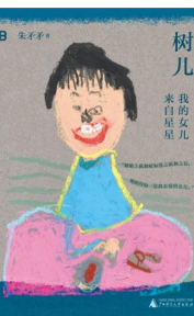
版本：广西师范大学出版社 作者：朱矛矛 《树儿：我的女儿来自星星》