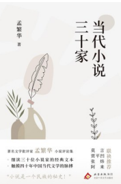
版本：北京十月文艺出版社 作者：孟繁华 《当代小说三十家》