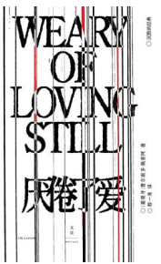
版本：上海人民出版社 作者：费尔南多·佩索阿 《厌倦了爱》