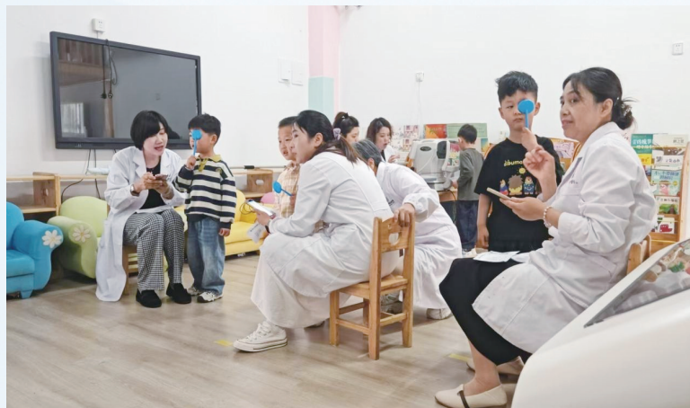
盐城仁禾眼科医院为孩子检查视力。

除了专业的视力检查,眼科医护人员还现场示范了正确的读写姿势,以生动有趣的方式向孩子们展示了如何在日常生活中保护眼睛。他们强调了合理饮食、多参与户外活动对保护眼睛的重要性,