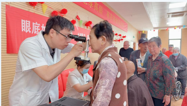
建阳眼科医院为老年人免费筛查眼科疾病。

值得一提的是,医院还注重加强公益活动,提升社会责任。2024年度完成政府实事工程,3月起至11月完成贫困白内障患者手术人数为400例,低视力儿童94名完成康复任