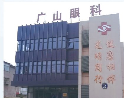
东台市广山卫生院眼科积极为民服务。

12面锦旗反映人心,各类技能竞赛成绩突出……2024年,广山卫生院的医疗工作获得了大家的肯定与信任,特色眼科成绩更是亮眼。该院充分发挥传统眼科特色医疗的龙头优势。其眼科先后被评为盐城市乡镇专科特色科室、江苏省基层特色科室,并获得全省首批“白内障超声乳化”技术准入资格,成功加入省基层眼科联盟,与南通大学附属医院眼科签订孵化中心协议。