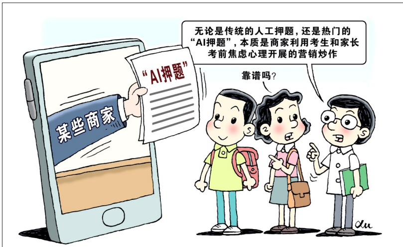
谨防营销陷阱 新华社发 徐骏作

教育部近日也提示,高考命题持续深化改革,更加注重考查考生关键能力、学科素养和思维品质,突出反押题、反套路的导向。依靠AI或所谓“专家”押中题目的可能性极小。考生将大量精力投入到“押题卷”,不仅在备考时间安排上得不偿失,也容易被不法商家所骗,带来经济和心里的双重损失。