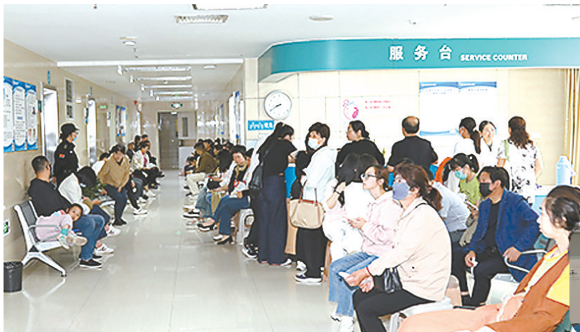
市民等待专家检查。

5月31日上午8时30分,记者来到亭湖区人民医院,只见门诊三楼超声医学科候诊大厅坐满了人,连彩超9室门外过道两边也有序地排着长队,他们都在等待著名超声专家武心萍做相关检查诊断。与此同时,在二楼的手术4室,已经完成两台手术的上海东方医院黄安华教授正在为下一台手术做准备。尽管当天是传统的端午佳节,但分别从南京和上海来的两位名医如约而至,一大早热情地为病患诊疗。亭湖区人民医院坚持“名医工作室”常态化,让群众在“家门口”就能享受高质量医疗服务的系列举措受到各方好评。