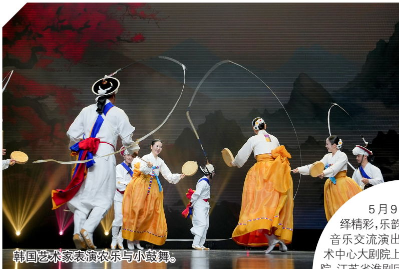
韩国艺术家表演农乐与小鼓舞。