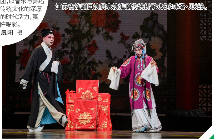
江苏省淮剧团演员表演淮剧传统折子戏《珍珠塔·见姑》。

5月9日晚,“‘盐’绎精彩,乐韵同行”中韩传统音乐交流演出在盐城市文化艺术中心大剧院上演。盐城市歌舞剧院、江苏省淮剧团携手韩国国立国乐院民俗乐团与舞蹈团,以音乐与舞蹈为纽带,展现两国传统文化的深厚底蕴与艺术创新的时代活力,赢得现场观众阵阵喝彩。