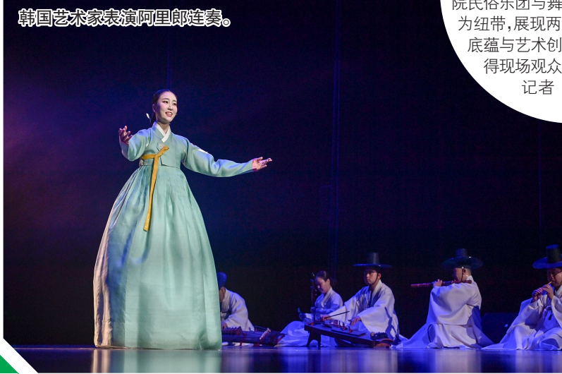
韩国艺术家表演阿里郎连奏。