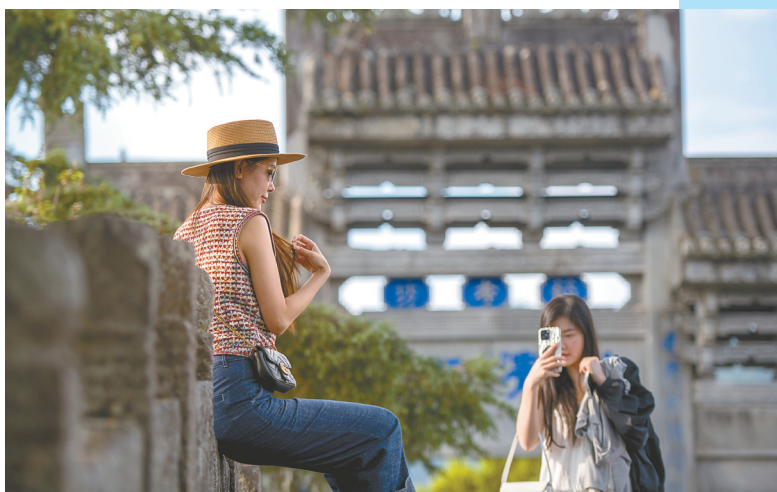
4月19日,游客在和顺古镇拍照游玩。