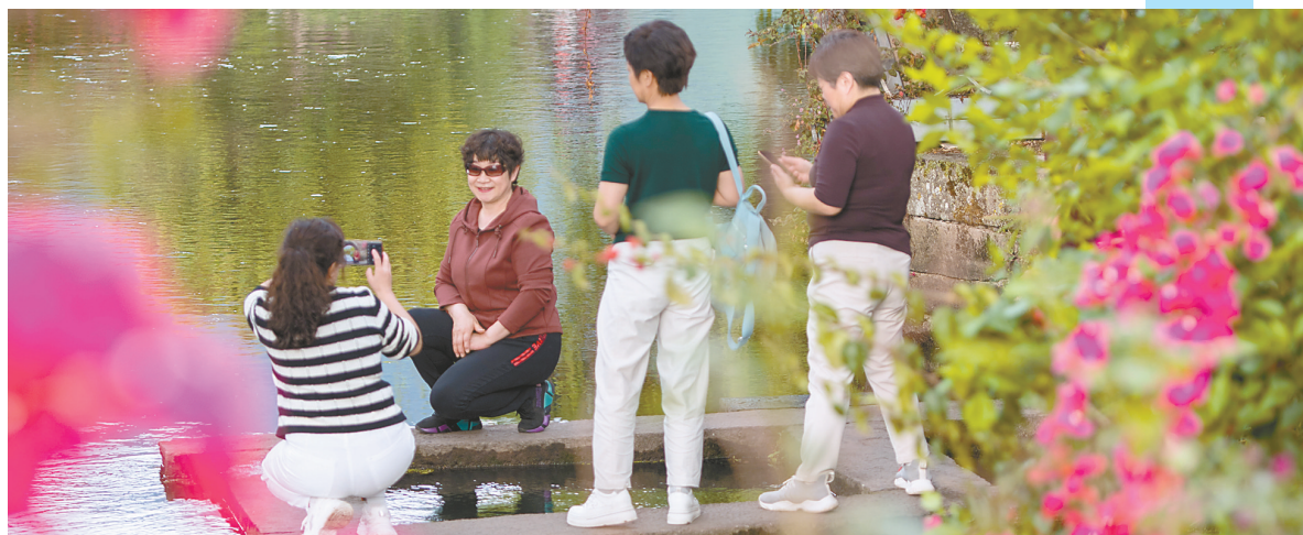
4月19日,游客在和顺古镇游玩拍照。