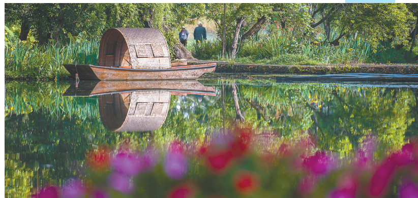
4月19日,游客在和顺古镇游玩。