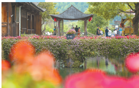
4月19日,游客在和顺古镇游玩。