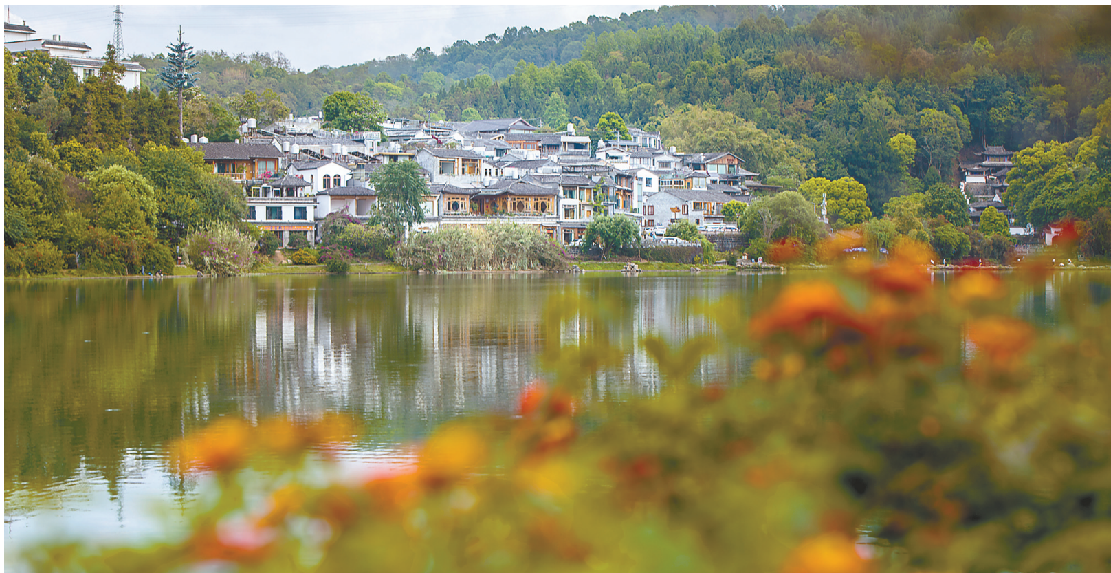
4月19日在和顺古镇拍摄的一景。彭奕凯 摄