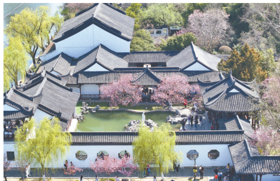
↑3月22日,游人在江苏南京莫愁湖公园赏花游玩(无人机照片)。