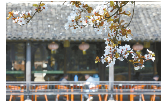
↑3月22日,游人在浙江省嘉兴市南湖区月河历史街区休闲。