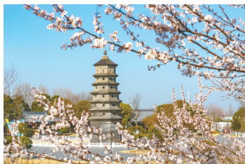
↔3月21日,在江苏东台拍摄的春花掩映中的海春轩塔。