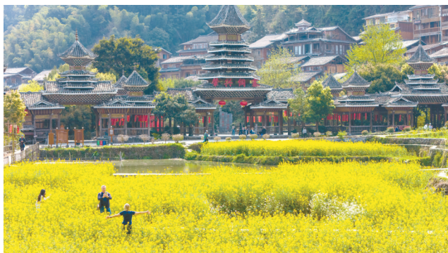
↑3月22日,游客在贵州黎平肇兴侗寨的油菜花间游玩。