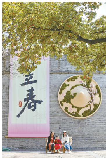
↑3月22日,在浙江省嘉兴市南湖区子城遗址公园,游人在古城墙巨型“迎春”“斗笠”创意装饰前拍照。

当古建与春天相遇,是一场跨越时空的浪漫邂逅。这一刻,历史在春风的轻拂下褪去沧桑,在春光的照耀下展现生机,让人沉醉在穿越千年的美好画卷中。