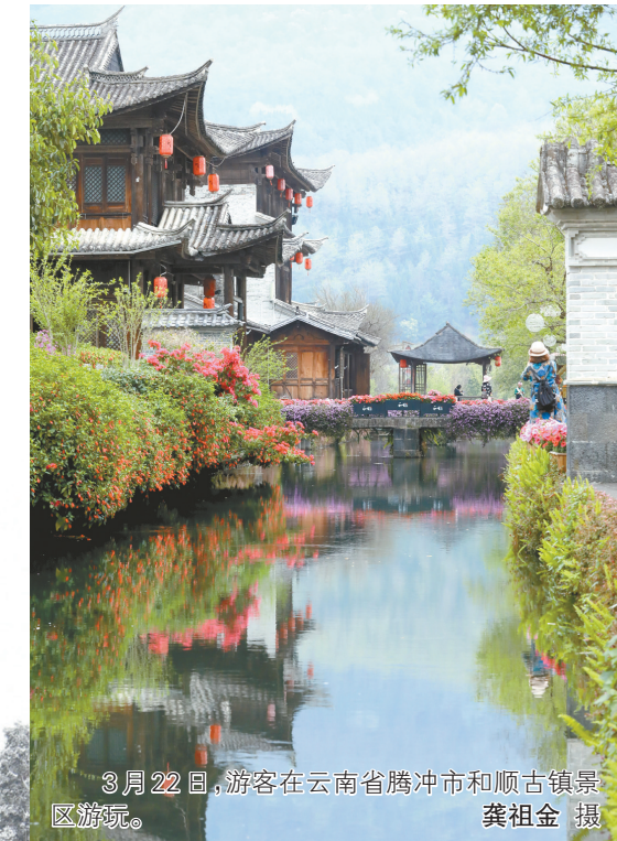
3月22日,游客在云南省腾冲市和顺古镇景区游玩。