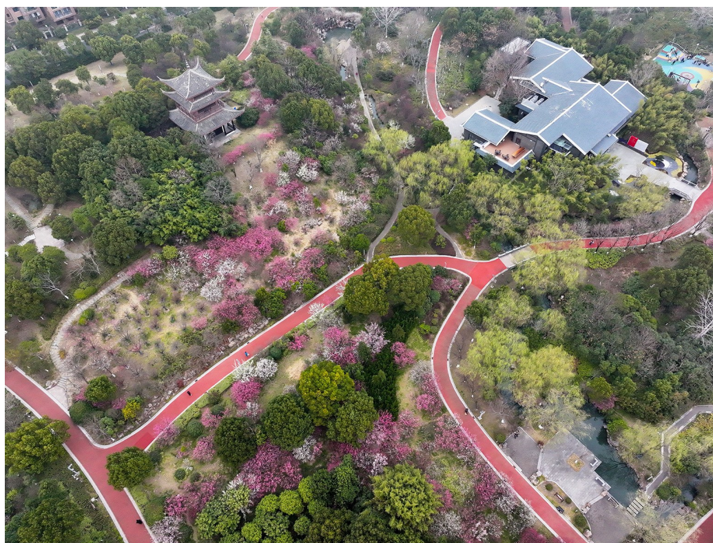
盐塘河公园梅花盛开