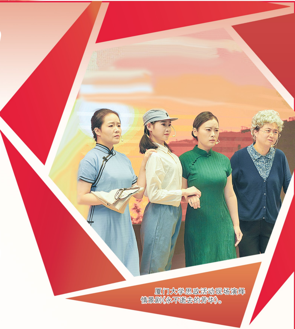
厦门大学思政活动现场演绎情景剧《永不逝去的芳华》。