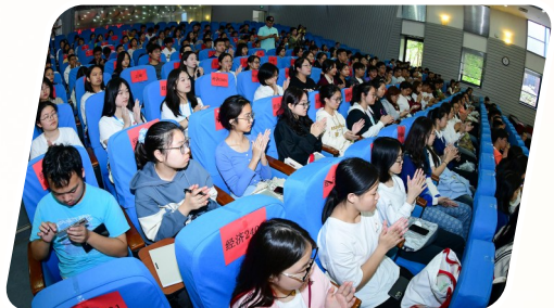
中国政法大学学生现场聆听思政课。