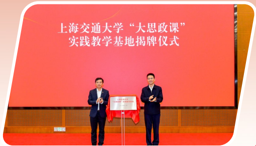
上海交通大学“大思政课”实践教学基地揭牌仪式。