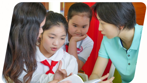
联合采访组记者采访雪枫中队少先队员。