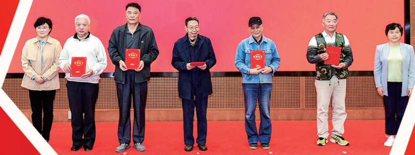
上海活动现场新四军亲属代表捐赠文物和史料。