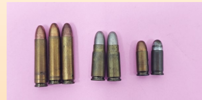
见证杨得志将军军旅生涯的子弹。