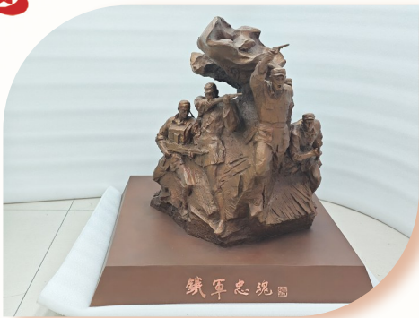
《铁军忠魂》雕塑作品小样。