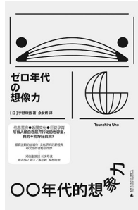
版本:广西师范大学出版社 作者:宇野常宽 《00年代的想象力》