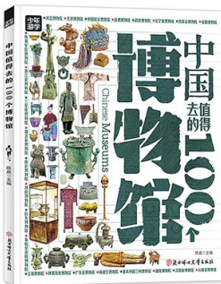
版本:北方妇女儿童出版社 作者:陈晨 《中国值得去的100个博物馆》

中国国家博物馆为综合类博物馆,代表性藏品有人面鱼纹彩陶盆等。如明代孝端皇后凤冠,共嵌天然红宝石百余块,珍珠5000余颗。其帽胎为漆竹扎成,衬以丝帛面料,前部饰