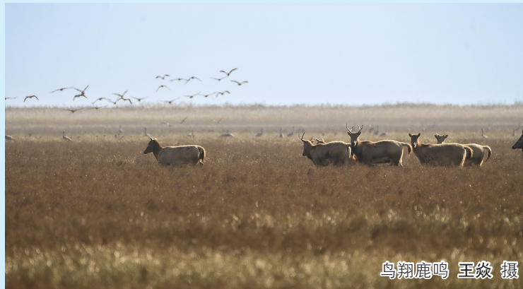
鸟翔鹿鸣