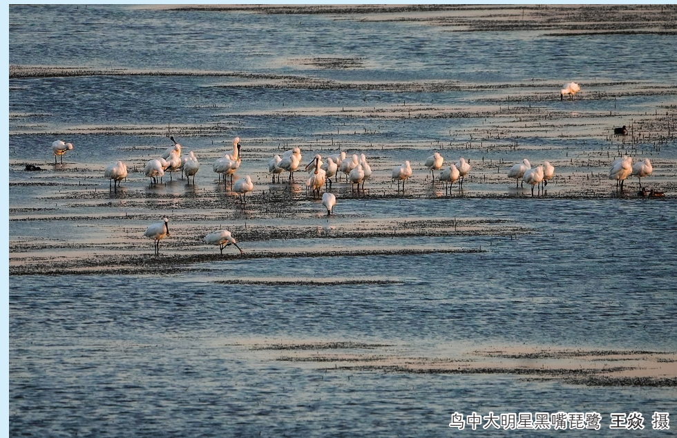
鸟中大明星黑嘴琵鹭