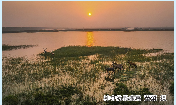
神奇的野鹿荡