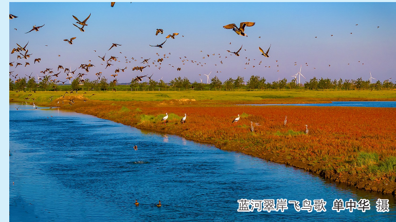
蓝河翠岸飞鸟歌