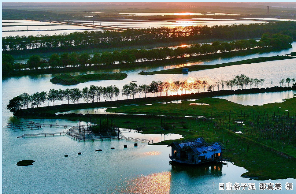
日出条子泥