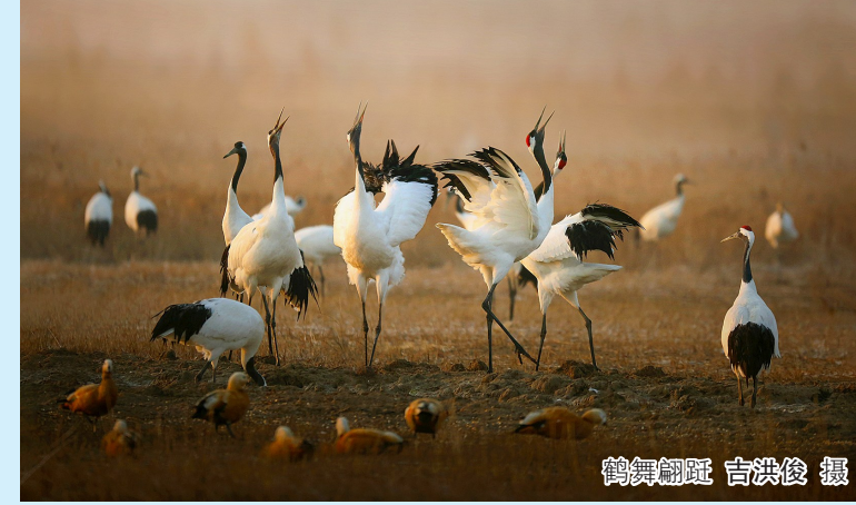
鹤舞翩跹