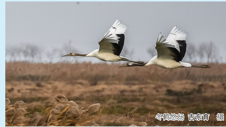
冬鹤悠扬