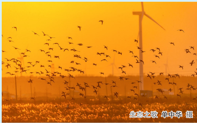
生态之歌