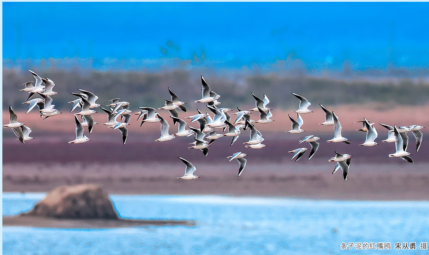
条子泥的红嘴鸥