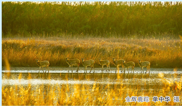
金辉鹿踪