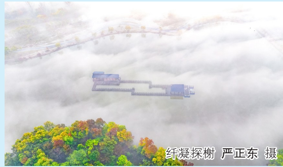
纤凝探榭

《影像》栏期待您的照片。 欢迎大家踊跃投稿,投稿邮箱:yfdzbyx@126.com。