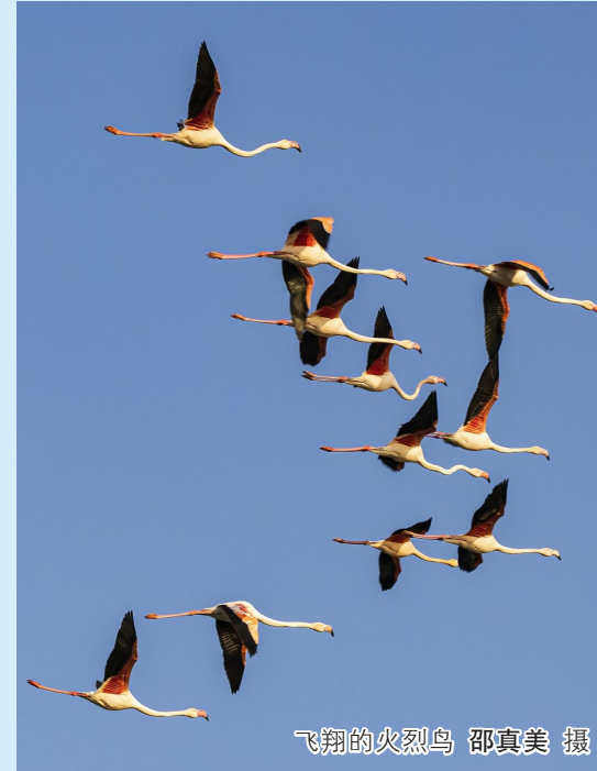
飞翔的火烈鸟