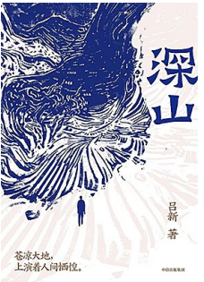
《深山》作者：吕新 版本：中信出版集团