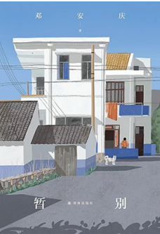
《暂别》作者：邓安庆 版本：译林出版社