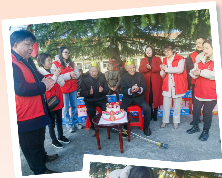
志愿者和两位老人一起唱生日歌