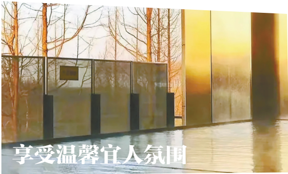
享受温馨宜人氛围

置身水杉林间,或抬头仰望,或伸手寻光,或不经意转身回眸,或仅仅倚靠树上,斑斓的水杉作背景,怎么拍都出片。沿着空中栈道前行,一步一景尽收眼底,伸手即可触碰红红的水杉树叶。 落叶纷飞间,感受林间穿梭的诗情画意,隐匿于水杉林海中的木屋散发着无尽的宁静与安逸。镜头下不仅捕捉了欢笑的瞬间,更将这份纯粹的美好永远定格。在这片自然的怀抱中,每一处细节都散发着迷人的魅力,让人沉醉其中,感受大自然独有的韵律与呼吸。