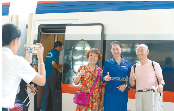
12月2日,在中老铁路老挝万象站内,旅客在“澜沧号”动车组前合影留念。

据新华社昆明12月3日电 记者从中国国家铁路集团有限公司获悉,截至12月2日,中老铁路开通运营满三年,运输安全保持稳定,累计发送旅客超4300万人次、运输货物4830万吨,黄金大通道效应日益凸显,为推进中老经济走廊建设、构建中老命运共