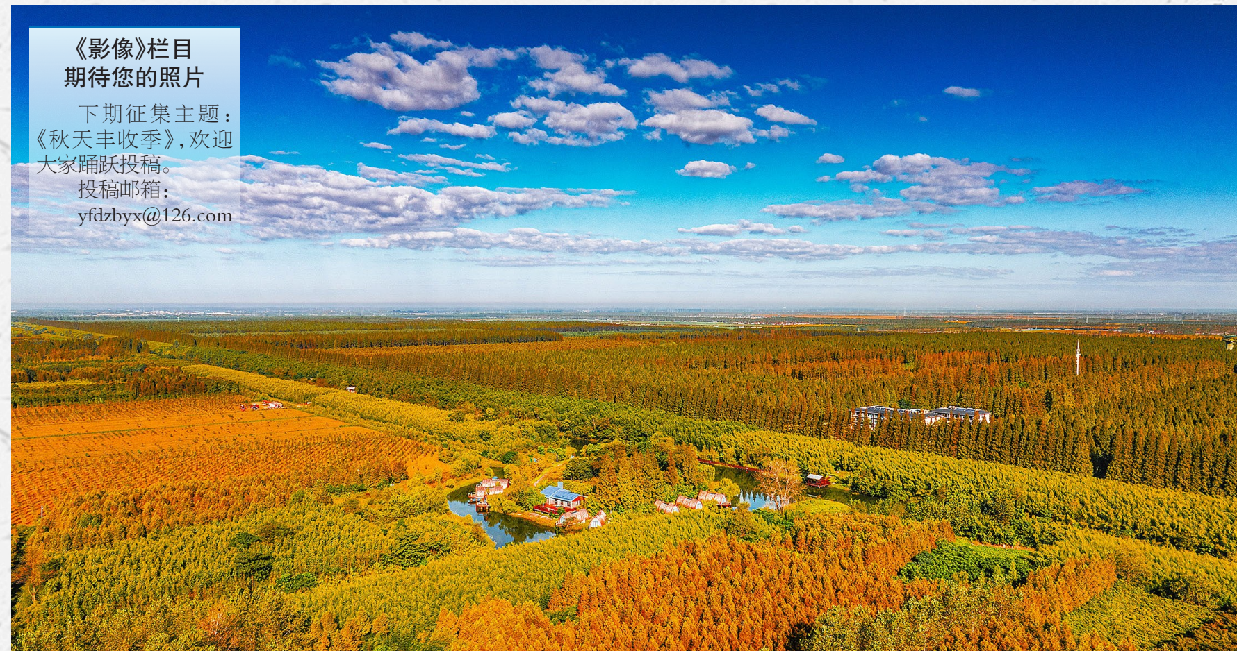
黄海森林公园秋韵