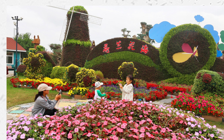
花海秋色