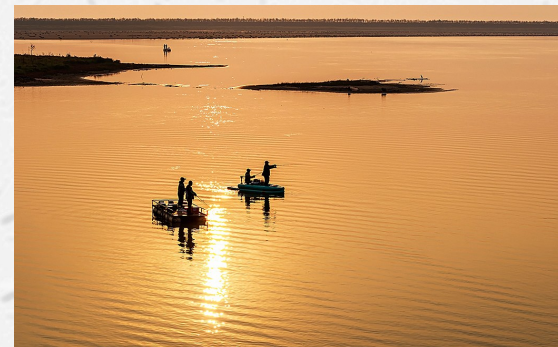
曙色垂钓