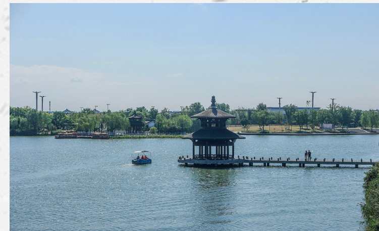
秋到大洋湾