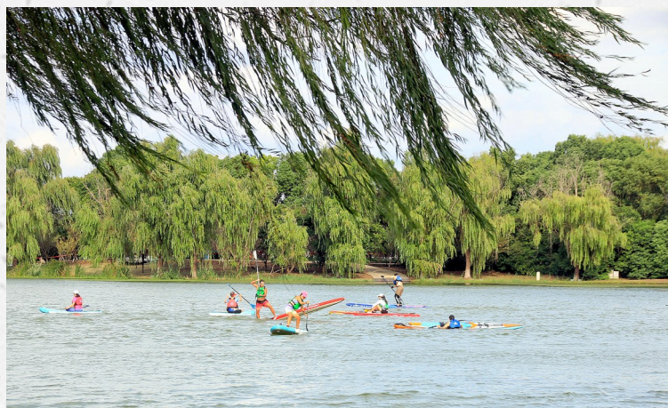
秋色如画 激情澎湃

秋高气爽,滩涂、森林开始披上了红色的盛装。街道两旁的树木,树叶逐渐由绿转黄,每当微风吹过,金黄的树叶便轻轻飘落,为大地铺上了一层厚厚的金色地毯。河边的芦苇荡也在秋风中轻轻摇曳,偶尔传来阵阵鸟鸣,更添几分生机与野趣。