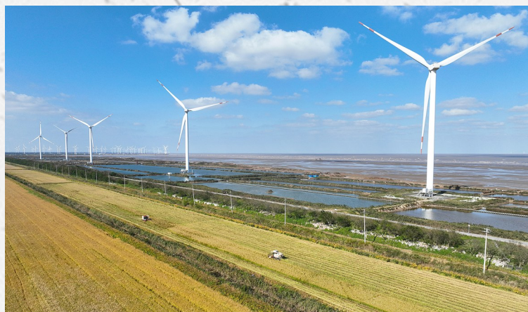
丰收大地