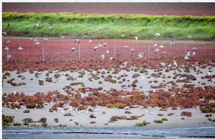
秋日湿地