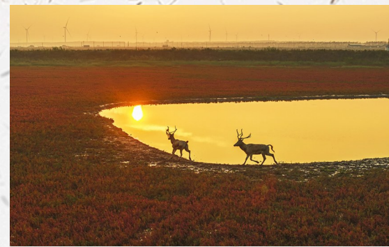
金色池塘