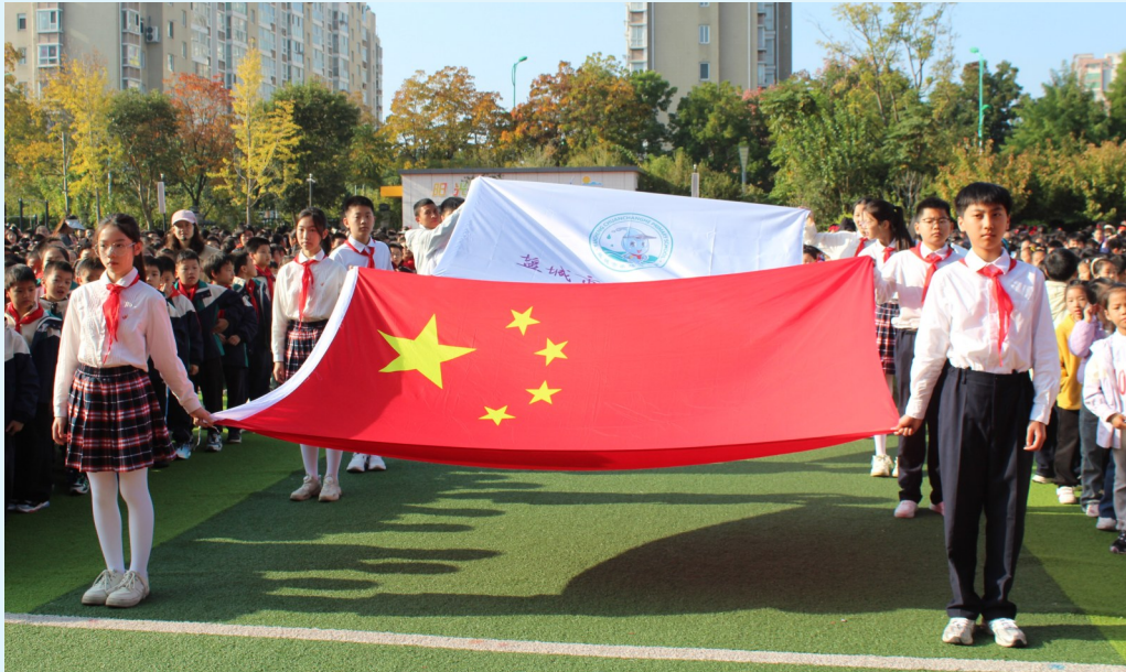
五星红旗引领队伍