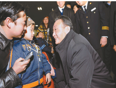
2008年2月3日,吴邦国同志在北京西站候车室与旅客交谈。