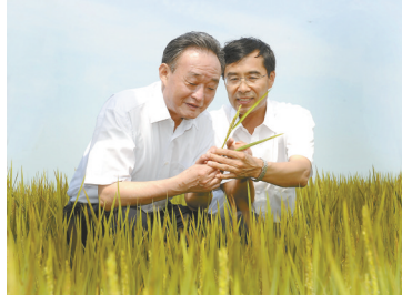
▲ 2012年7月19日,吴邦国同志在黑龙江农垦建三江管理局二道河农场万亩大地号察看水稻长势。新华社记者 谢环驰 摄