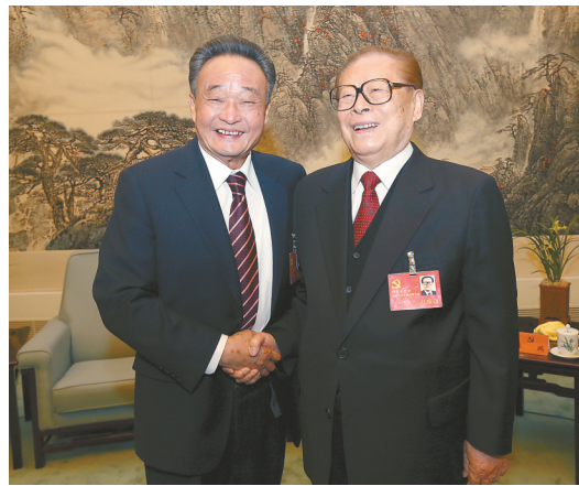
2012年11月14日,中国共产党第十八次全国代表大会在北京闭幕。这是闭幕会前,江泽民同志与吴邦国同志在一起。新华社记者 兰红光 摄