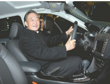
2010年1月30日,吴邦国同志在上海汽车集团股份有限公司技术中心察看新能源车。