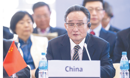
▲ 2013年1月28日,吴邦国同志在俄罗斯符拉迪沃斯托克出席亚太会议论坛第21届年会,并作题为《坚持和平发展 促进合作共赢》的主旨发言。