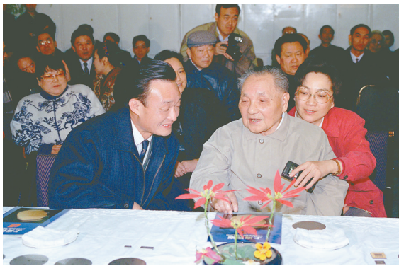
▲ 1992年2月10日,邓小平同志在上海贝岭微电子制造有限公司参观时与吴邦国同志交谈。