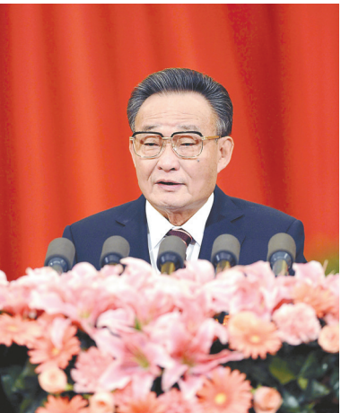
2011年3月10日,十一届全国人大四次会议在北京人民大会堂举行第二次全体会议。吴邦国同志作全国人民代表大会常务委员会工作报告。