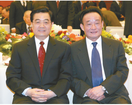
2005年1月1日,全国政协在北京举行新年茶话会。这是胡锦涛同志与吴邦国同志在一起。

1994年9月,吴邦国同志在中共十四届四中全会上增补为中央书记处书记。1995年3月,任国务院副总理,负责国有企业改革、工交生产、基础设施建设等方面工作。其间,兼任国务院三峡工程建设委员会副主任、中央大型企业工委书记、中央企业工委副书记等。他强调国有企业改革是整个经济体制改革的中心环节,坚持社会主义市场经济改革方向,正确处理改革发展稳定的关系,大胆创新、勇于实践,从纺织行业开始,从龙头骨干企业入手,一个行业一个行业地攻坚克难,为深化国有企业改革做了大量卓有成效的工作。在中央政治局常委会领导下,他主持起草《中共中央关于国有企业改革和发展若干重大问题的决定》,全面总结国有企业改革和发展的基本经验,明确国有企业改革和发展的指导方针,提出搞好国有企业改革和发展的一系列重大政策措施。他认真落实党中央和国务院决策部署,坚持改制改组改造和加强管理相结合,推动国有大中型企业改革和脱困三年目标如期基本实现。他高度重视加快现代企业制度建设,按照“产权清晰、权责明确、政企分开、管理科学”的要求,积极推行规范的公司制和股份制改革,完善法人治理结构,深化企业内部分配、人事、劳动制度变革,推动国有大中型骨干企业建立现代企业制度。(下转3版)