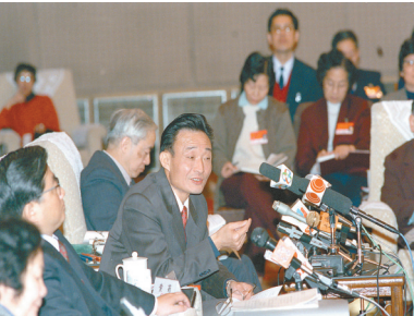
1994年3月,时任上海市委书记的吴邦国同志在全国两会上海代表团全团会议上。