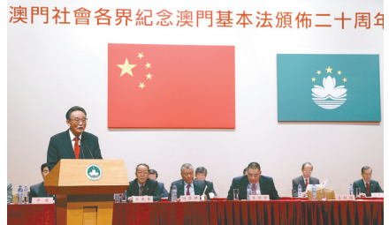
▲ 2013年2月21日,吴邦国同志在澳门文化中心出席澳门社会各界纪念澳门基本法颁布20周年启动大会并发表讲话。