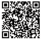
扫一扫 看视频 视频制作:金建华

围中体验、学习并掌握科普知识,盐城科技馆多方准备,不仅展馆里给大家讲解耳熟能详的知识,更是邀请专业人士现场授课,给大家展示科学的魅力。去年,盐城科技馆就邀请了牛津大学博士、北京化工大学特聘教授戴伟,给孩子们上了一堂精彩的化学科普讲座《什么是化学反应》,受到大家欢迎。今后,盐城科技馆还将继续前行,用好奇心的天性去引导孩子对科学的兴趣,带着孩子们了解更多的科学知识,掌握科学方法,形成一大批具备科学家潜质的青少年群体。同时将广泛统筹科普资源,营造良好的科技育人环境,创新科学教学模式,让孩子们在轻松有趣的氛围中感受科学魅力、学习科学知识、涵养科学精神,真正做到寓教于乐、寓学于趣。