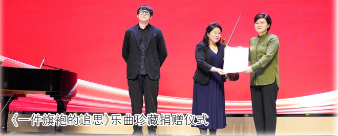
《一件旗袍的追思》乐曲珍藏捐赠仪式