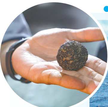
“开拓二号”在海底开采获取的深海矿产样品(6月24日摄)。

上海交通大学自主研制的深海重载作业采矿车工程样机“开拓二号”海试现场(无人机照片,6月22日摄)。