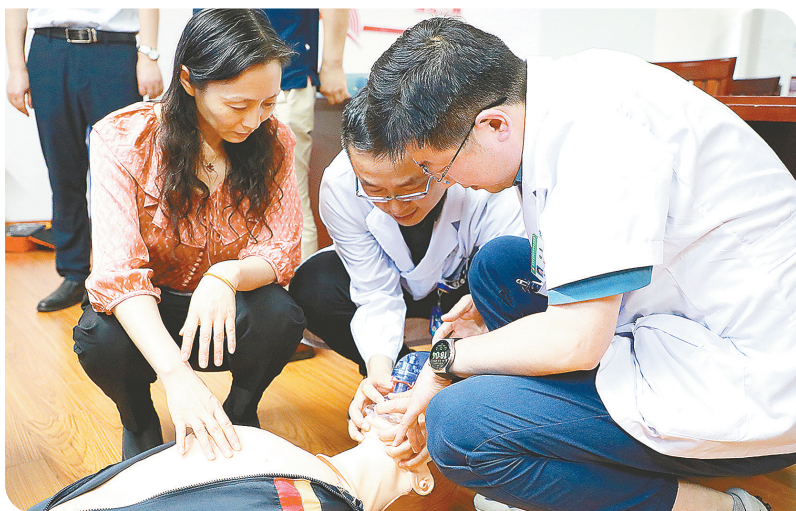
亭湖区医共体专家巡诊系列活动

力,更好地满足人民群众看病就医需求,亭湖区坚持以人民健康为中心,认真贯彻落实国家卫健委《关于全面推进紧密型县域医疗卫生共同体建设的指导意见》文件精神,逐步建立起多层次、全覆盖、科学合理的城乡医院对口支援工作格局,让优质医疗资源下沉,让老百姓享受更多优质医疗服务。亭湖区人民医院积极推进这一惠民举措,下派人员到基层医院驻扎交