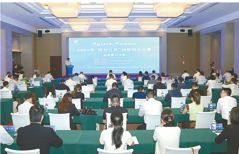
会议现场

吸引力和影响力,不断扩大产业覆盖面,在发掘优质科技初创企业、促进优质项目投融资对接、服务科技中小企业成长等方面持续发力,努力打造科技自立自强的创新资源高地,为中国式现代化江苏新实践提供更为坚实的科技支撑与人才保障。