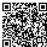
扫一扫 看视频 视频制作 陈晗