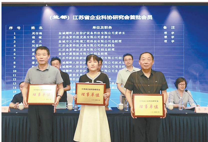
大赛现场

“自2020年公司成立企业科协以来,我们始终致力于发挥科协在推动科技创新、服务企业发展中的桥梁纽带作用,不仅注重提升员工的科学素养,还积极推动产学研深度融合,公司的科技创新工作因此取得了显著成效。”盐城耀晖人防防护设备科技有限公司科协主席周传海进行了深入的经验分享,认为建立完善的科协组织体系、实施多元化的人才融合策略、积极开展员工技术创新活动、加强与高校及科研机构的战略合作,是