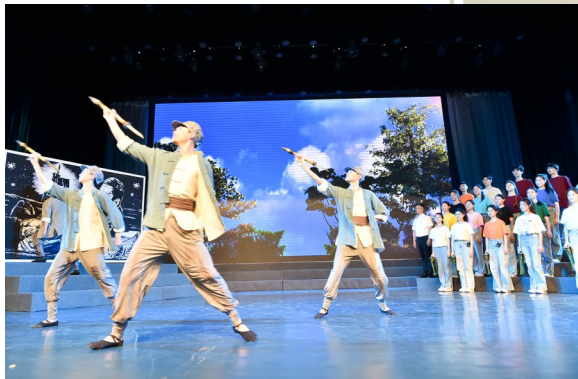
《华中鲁艺记》排练现场。

记者获悉,《文耀中华》节目共12集,每集时长约45分钟,计划于2024年10月播出。