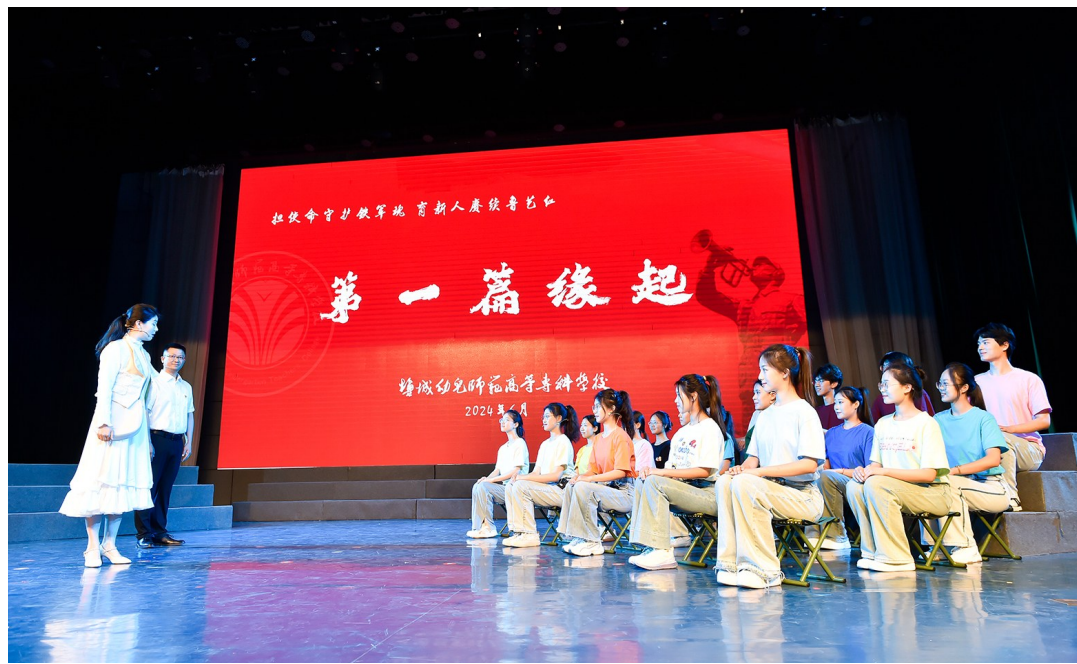
盐城幼专学生排练《华中鲁艺记》。

盐城晚报讯 6月17日至19日,由国家广播电视总局指导,江苏省委宣传部、江苏省广播电视局、江苏省广播电视总台联合出品的大型通俗理论节目《文耀中华》项目组来盐城,对华中鲁艺烈士王海纹“一件旗袍”的故事进行采访拍摄。