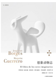
版本:上海译文出版社 作者:博尔赫斯、玛加丽塔·格雷罗 《想象动物志》

小说以故事见长,以武生剧目中极具难度的一出独角戏“林冲夜奔”为题眼,围绕着戏剧舞台上少之又少的女武生展开,从1940年到当下,以世界为背景,描摹了四代女艺人对艺术和人生道路的不同追求。在时代的洪流里,戏剧的式微是难以避免的,从人声鼎沸退回到小小的圈子里,可无论前路再难,总有人保有一种热血与天真。