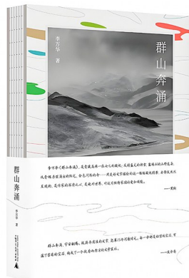
版本:广西师范大学出版社 作者:李万华 《群山奔涌》

除了高原上的天空、云朵,李万华也饶有兴致地介绍了高原上的野草、灌木、溪流、积雪、鼠兔、牛羊和阳光。不管是有生命的,还是没有生命的,李万华都向我们娓娓道来,仿佛缓缓展开了一卷巨幅画轴。其实,群山是不会奔涌的,奔涌的永远是活跃在高原上的河流、动物和人而已。但李万华这么随意一讲,似乎整个画面就变得栩栩如生起来。李万华以青藏高原为背景的文字,极具地域特色,回旋自如,浑然天成,毫无雕琢痕迹。既有博物学的严谨,又有文学的细腻,读之能从中获得一种沉静、深邃的品质,且