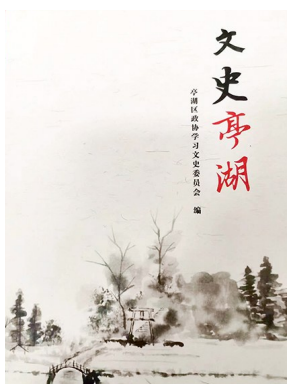
版本:江苏人民出版社 编辑:刘汉江 《文史亭湖》

垒一口坯灶/岁月的风雨/在烈火中煎熬/跌倒成黄昏/又慢慢站成黎明/日子,总是腌着/苦咸苦咸的味道……”作者用寥寥数语交代了盐城以盐而名的来历,描述了盐城先民们煮海为盐的艰辛和不屈不挠的坚强品格,同时也寄托了对先民们苦难生活的深切同情。