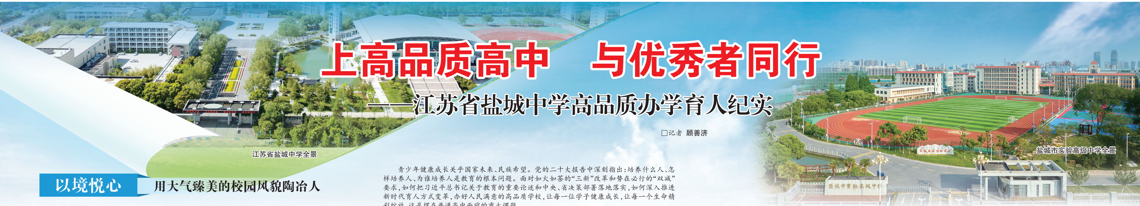
江苏省盐城中学全景