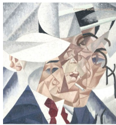
A Portrait of the Artist as a Young Man 一个青年艺术家的肖像 James Joyce 詹姆斯·乔伊斯 著

乔伊斯从心理学层面入手,一改现实主义小说朝向外部世界的传统方法,转而将视角投向内心层面。尽管还是日常叙事,但叙事主体却区分出