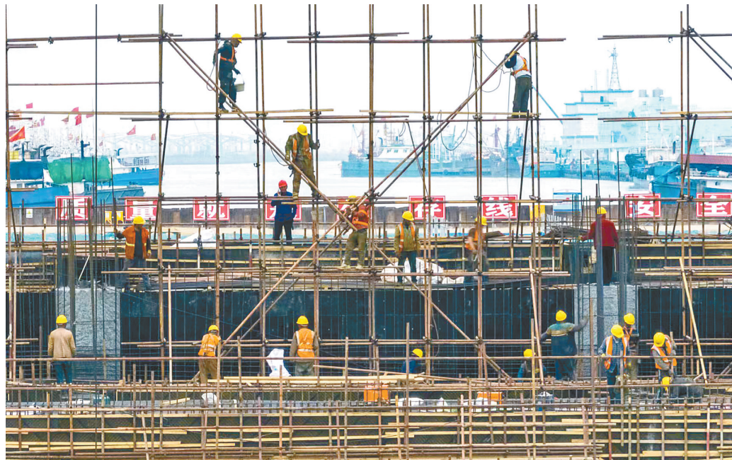
施工人员紧张作业。

近日,在盐城市黄沙港闸拆建工程工地,280多名劳动者在闸室主体、防冲灌注桩帽梁、护岸挡墙、消力池、海漫等作业面有序作业,塔吊、挖机、泵车、自卸车等大型设备配合无间。建设、设计、监理、施工、检测等单位以超常举措推进工程建设提速,为保障黄沙港汛期具备挡洪排涝条件奋力拼搏。