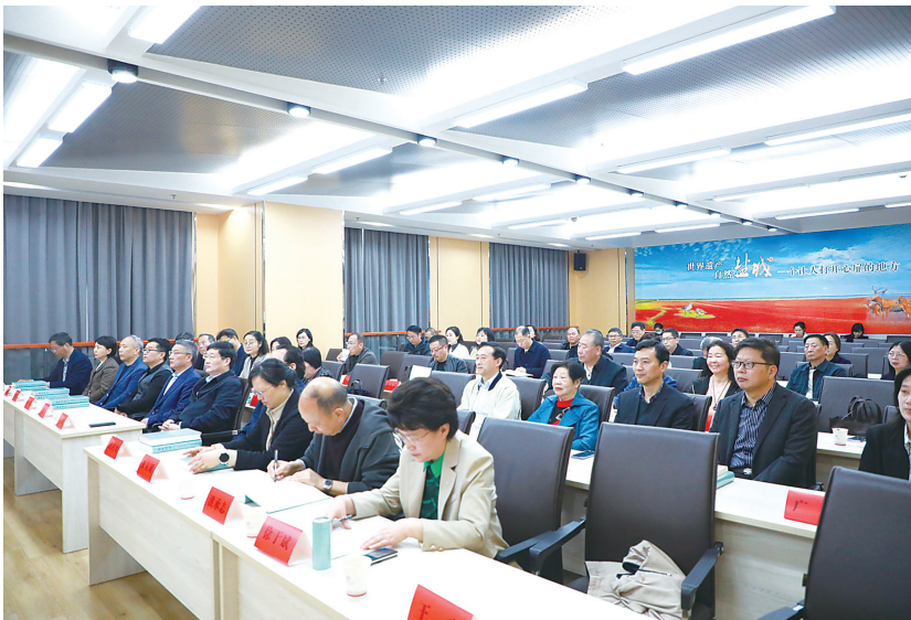
《盐城诗征》新书发布会揭幕。