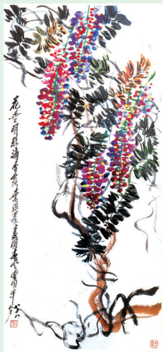
《花垂明珠滴香露 叶张翠盖团春风》