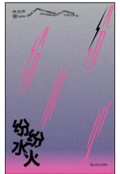
《纷纷水火》 作者:林戈声 版本:上海文艺出版社