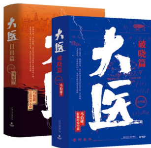
《大医》 作者:马伯庸 版本:上海文艺出版社

倘若不是读了这本小说,我不知道,除了从小就知道的白求恩大夫,还有那么多国际红十字会的公共慈善