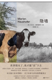
《隐墙》 作者:玛尔伦·豪斯霍费尔 版本:北京联合出版公司