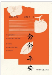
《念安》 作者:苏枕书 版本:湖南文艺出版社