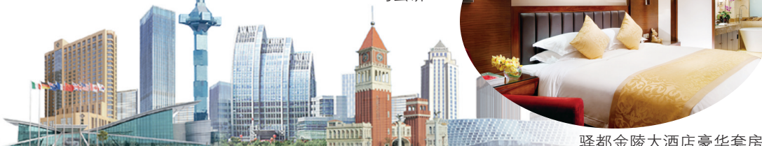
驿都金陵大酒店豪华套房