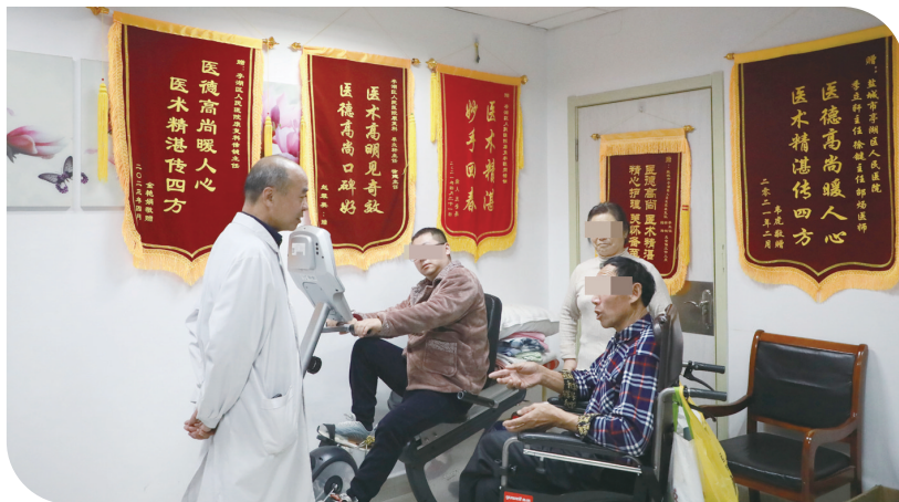
患者进行康复训练。

活压力大、睡眠困难的问题开设了睡眠功能障碍康复项目,效果也很好,许多患者慕名而来。此外,小孩的脊柱侧弯康复功能效果也不错,这些有特色的康复项目是科室的累累硕果。“我们不会停留在现在,我们还有更高的追求和发展方向。”接下来科室还将继续开展新项目的治疗,如富血小板血浆关节腔注射项目、呼吸康复项目治疗,都在有条不紊推进中,不久的将来,更多患者将享受到医院提供的优质医疗资源和服务。