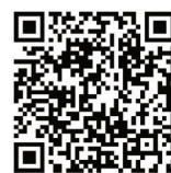
扫一扫 看视频 视频制作:金建华

复专委会副主委,中国心脏联盟心血管疾病预防与康复学会江苏联盟主委,省康复医学会副会长,省物理医学与康复学会副主委,省重症康复专委会主委,南京市物理医学与康复学会主委。国家重点研发计划“脑卒中康复机器人”(2017)课题负责人,国家十二五科技支撑项目“脑卒中后痉挛的中医康复临床规范研究”课题分中心负责人,主持4项国家自然科学基金课题面上项目及多个省部级课题;近五年在各类杂志发表论文30余篇,SCI收录近20篇;最新科研成果获2020年中国康复医学会科学技术二等奖。擅长心脑血管病康复及重症康复诊疗,尤其擅长神经康复、心肺康复、重症康复等。