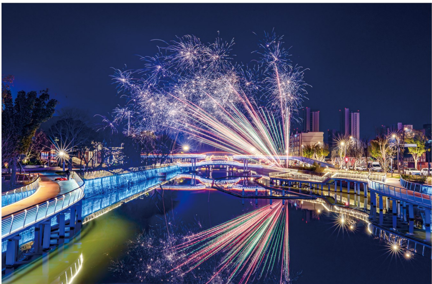
七彩烟花