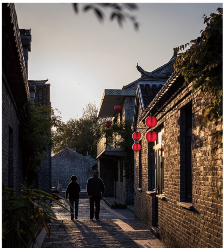
斜阳夕照