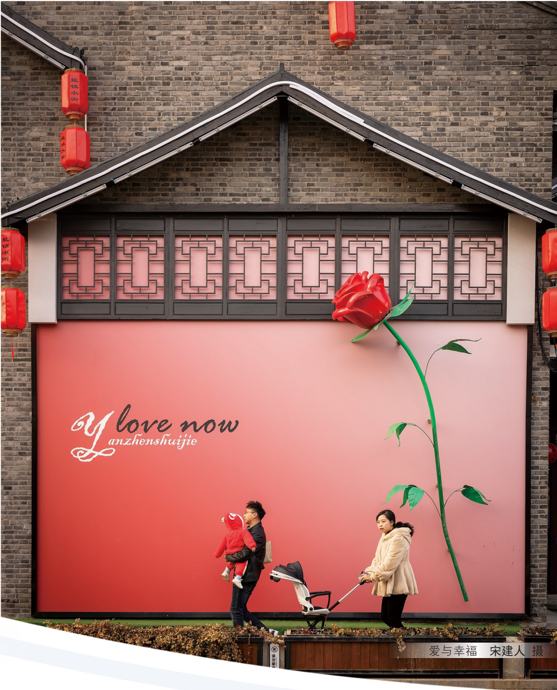
爱与幸福