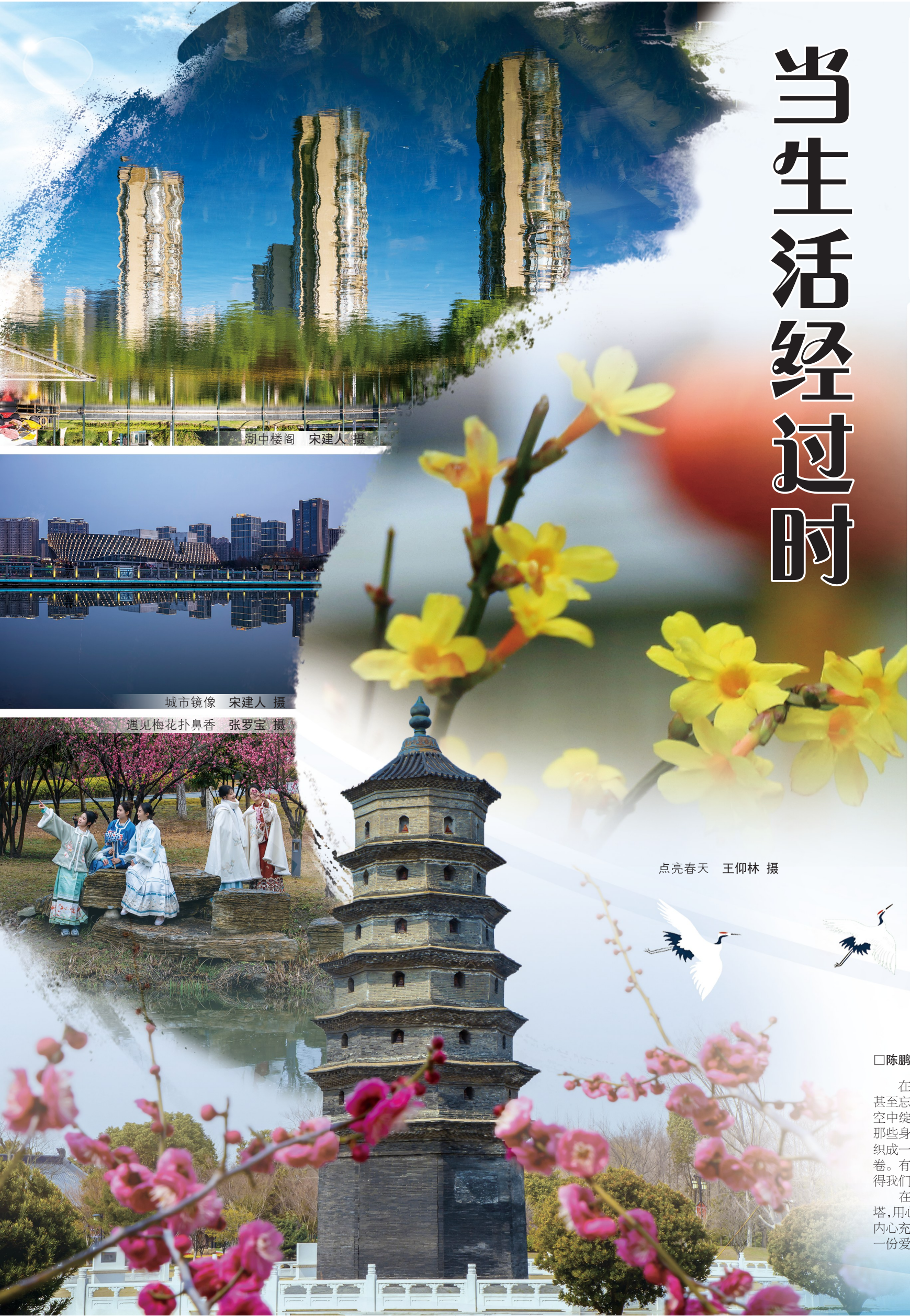
湖中楼阁