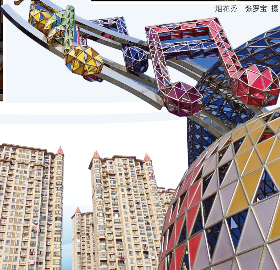
城市乐章