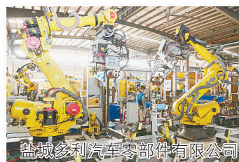
盐城多利汽车零部件有限公司