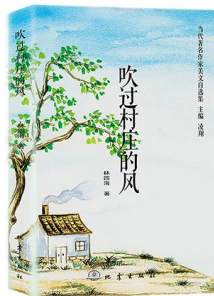
版本：地震出版社 作者：林四海 《吹过村庄的风》

这本由地震出版社出版的散文集共六辑，前三辑：遥远的故乡、吹过村庄的风、走在乡村的路上，写的都是故乡、村庄、乡村里的人和事；后三辑：在你的目光里缠绵、舌尖上的记忆、开满鲜花的滩涂，作者的写作半径进一步扩大延展，这些篇什里，所写的有亲情、友情、爱情，有美味、美景、美人，通