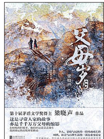
版本：北京联合出版公司 作者：梁晓声 《父母岁月》