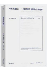
版本：商务印书馆 译者：邓宁立 作者：【美】简·赫斯菲尔德 副标题：如何进入诗歌的心灵世界

既是寻常人家的故事，亦是千千万万父母的缩影。作者立足底层，用跌宕起伏的叙事结构，谱写了与新中国同龄那代人的悲欢离合，彰显了浓厚的人文情怀。我们不仅可以将其看作一段个人、家庭与民族的风雨成长路，还可以将其看作一部时代、社会与百姓生活的沧桑变迁史。 综合