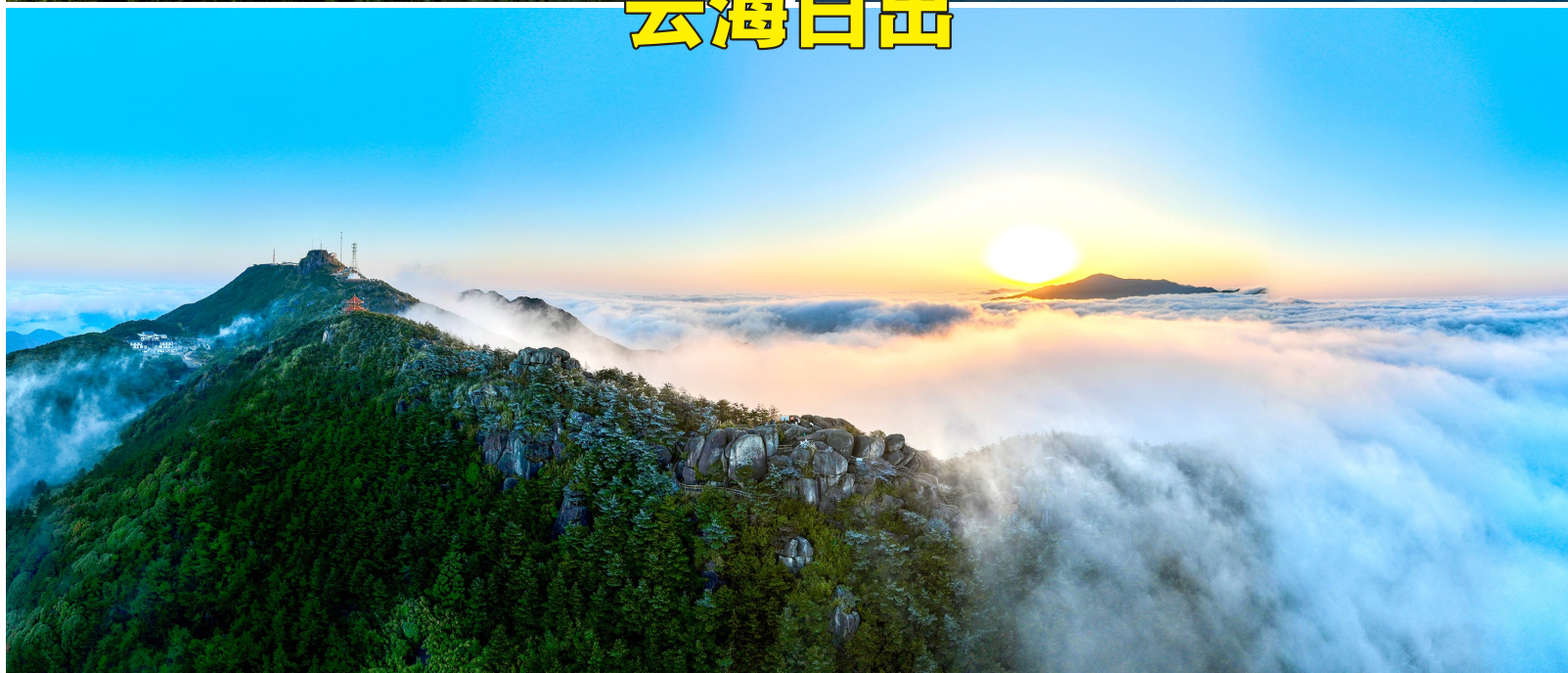
3月3日,福建戴云山脉出现云海日出景观,层峦叠翠的戴云群峰在云雾中若隐若现,秀美如画。