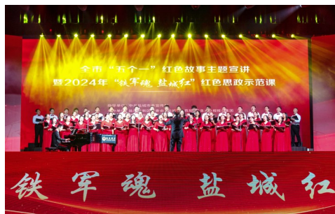
▲市“红土地”教师合唱演唱《江山》

盐城晚报讯 3月1日上午,全市“五个一”红色故事主题宣讲暨2024年“铁军魂 盐城红”红色思政示范课活动,在新弄里荔枝大剧院举行。