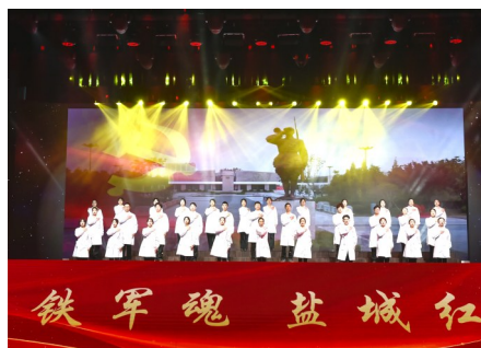
▲短剧《铁军传人·苏医红》