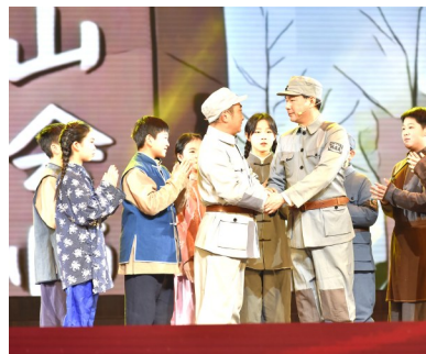
▲《一次会师·红色基因代代传》

在第三篇章“赓续血脉”中,日月路小学师生通过音乐朗诵的形式,深情讲述了新四军革命精神这一宝贵的精神财富。江苏医药职业学院、盐城市淮剧团联合演出的短剧《铁军传人·苏医红》取材于真实事例,展现了新四军革命精神的传承和发扬,盐阜大地处处有铁军传人。