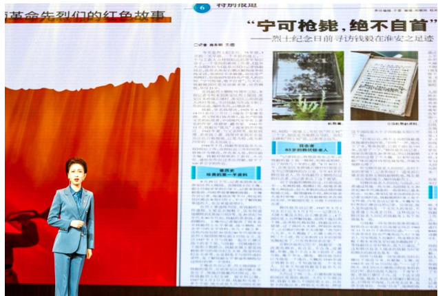
▼青春宣讲《给青春染上厚重的“中国红”》