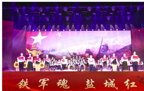
▲音乐诗朗诵《一种精神》

▲全市“五个一”红色故事主题宣讲暨2024年“铁军魂 盐城红”红色思政示范课活动