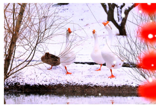
春雪鹅先知