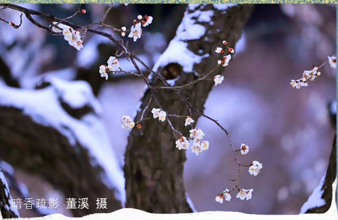
暗香疏影