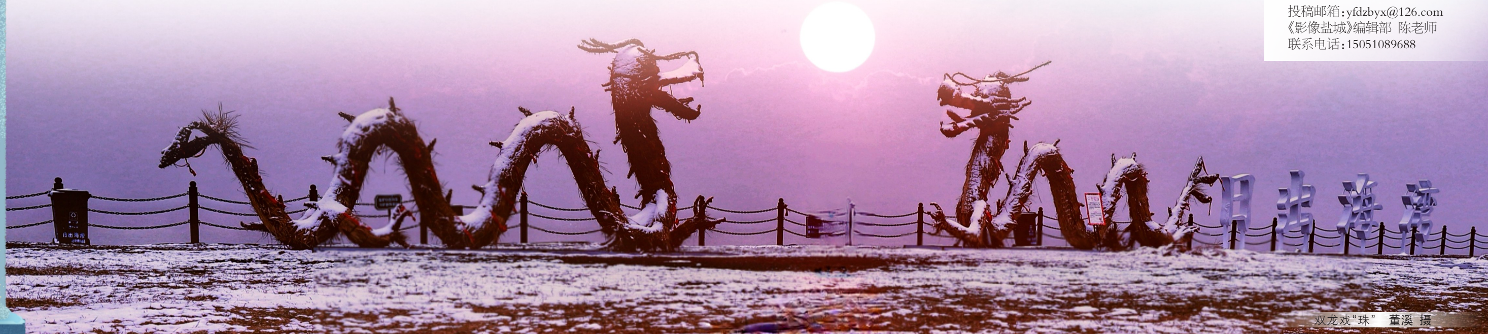
双龙戏“珠”

寒风翻阅着光阴的故事,遗落了几分冬的乐章。一夜间,雪纷扬而下,忽远忽近,如盐似糖,调出了冬天的味道。落雪成诗,雪中的温柔浪漫让人心醉,雪中的温馨幸福让人充满力量。雪中的湿地银装素裹,丹顶鹤悠然踱步,麋鹿嬉戏觅食。落雪无声,生怕惊扰这雪中精灵。漫天银色,皑皑白雪装点万物,裹在厚厚的棉衣里,走在未消融的雪上,听着脚底清脆踩雪声,望着身后的脚印,雪光闪烁,如梦如幻。雪倏然而落,如粉如沙,似白天鹅遗落的片片羽毛,顷刻间,树枝挂雪,纯洁剔透。白雪穿庭,窗中云影,皆非凡境。推窗观雪,寻一枝雪中怒放的梅花,踏雪而行,拥雪入怀。在雪中,走过冬天,看着雪在枝头上发芽,开出春天的花。