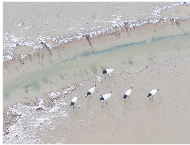
雪地观鹤