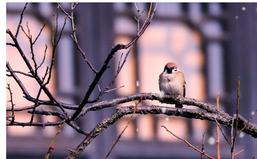
怒目而瞪