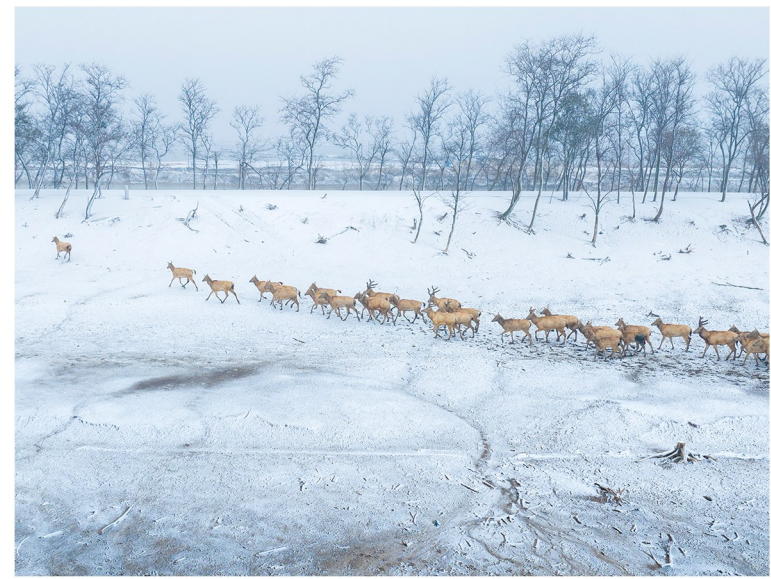
雪中精灵