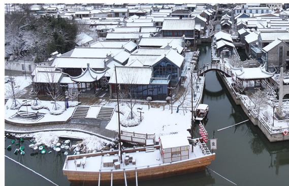
船舶人家