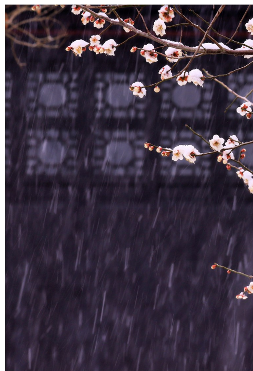
傲雪飘香