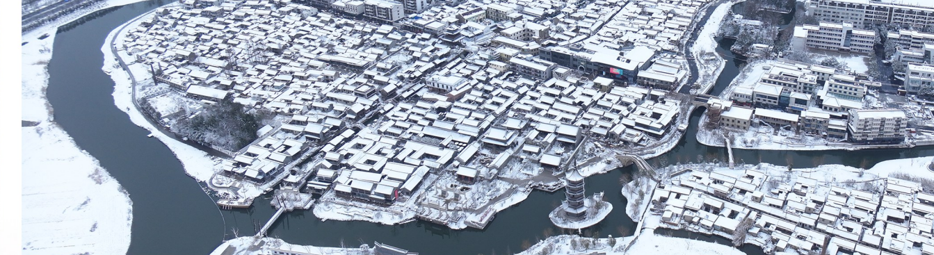
古镇披雪装