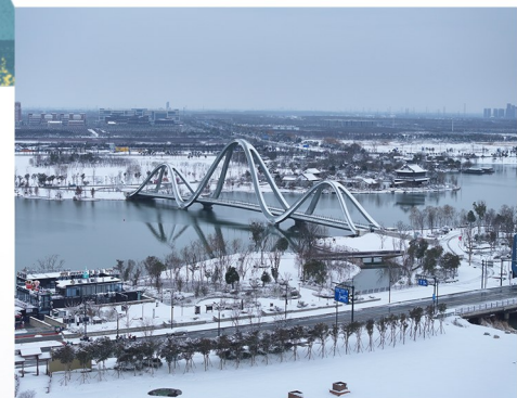
银装素裹