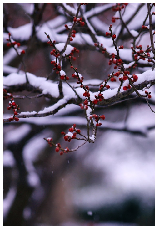
踏雪寻梅