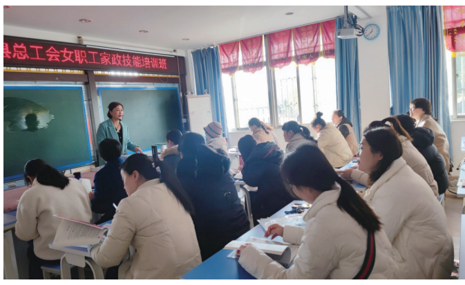
11月24日,阜宁县总工会在事事灵家政培训学校举办女职工家政收纳技能培训,来自全县各镇区(街道)、系统的54名女职工参加培训。