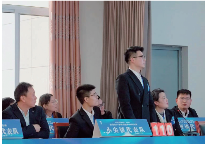
11月13日,响水县总工会、县应急管理局、县移动公司联合举办了响水县“安康杯”安全生产和劳动保护知识竞赛,来自全县的13支代表队39名选手报名参赛。

该市总工会始终坚持以职工为中心,带领非公企业工会开展“我为职工办实事”活动,加大职工服务力度,充分保障职工权益,充分发挥职工的“娘家人”作用。提升薪资待遇,奏响进取之音。建立工资增长机制,确保平均每年工资增长超过5%;公司一线员工最高月收入可达9000多元,优秀产业工人年均收入超15万元(含奖金)。加强员工关怀,奏响和谐之音。定期发放员工福利品、电影票,每月举办职工“庆生”活动;不定期慰问和帮扶家庭