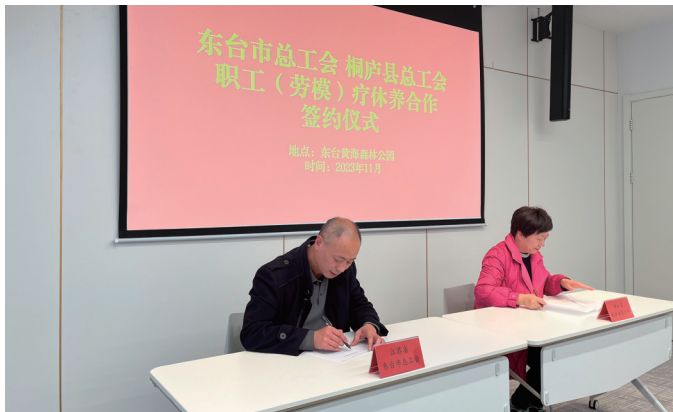
11月25日,东台市总工会和浙江桐庐县总工会在黄海国家森林公园签署《职工疗休养合作意向书》,双方商定结成职工疗休养战略合作伙伴,共同促进两地职工疗休养服务的深度合作。