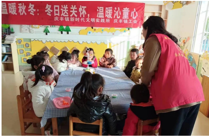
11月20日,是世界儿童日。建湖县庆丰镇工会联合新时代文明实践所组织开展“用爱温暖童心,用心呵护成长”主题活动,镇实践所、镇工会、志愿者、走进庆丰幼儿园,营造关心关爱儿童的浓厚氛围。